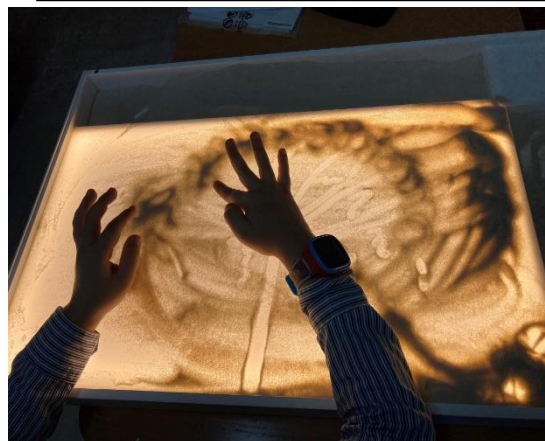
Рис.5. Рисование для развитие мелкой моторики