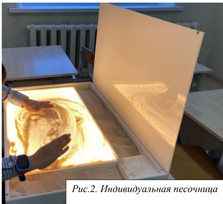
Рис.2. Индивидуальная песочница

Для индивидуального использования имеются песочницы, которые устанавливаются на парту. Размер такой песочницы соответствует оптимальному зрительному восприятию ребенка, данный размер позволяет охватить взглядом все пространство песочницы. Заполняется данная песочница специальным песком мелкой фракции, который проходит специальную обработку и просушку. Перед занятиями руки ребенка обрабатываются детским