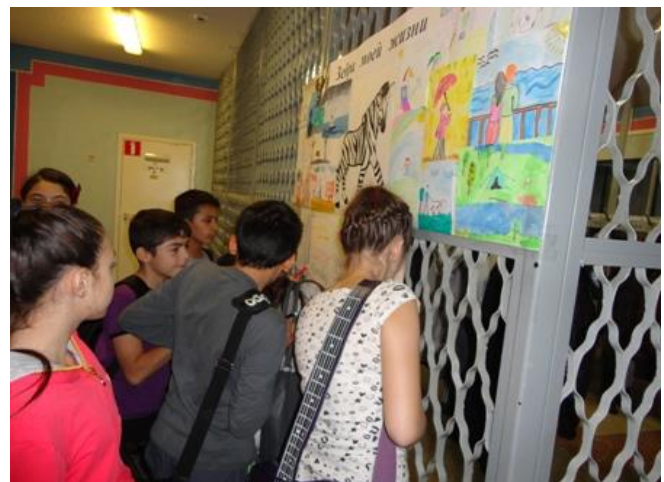
Выставка творческих работ «Зебра моей жизни»