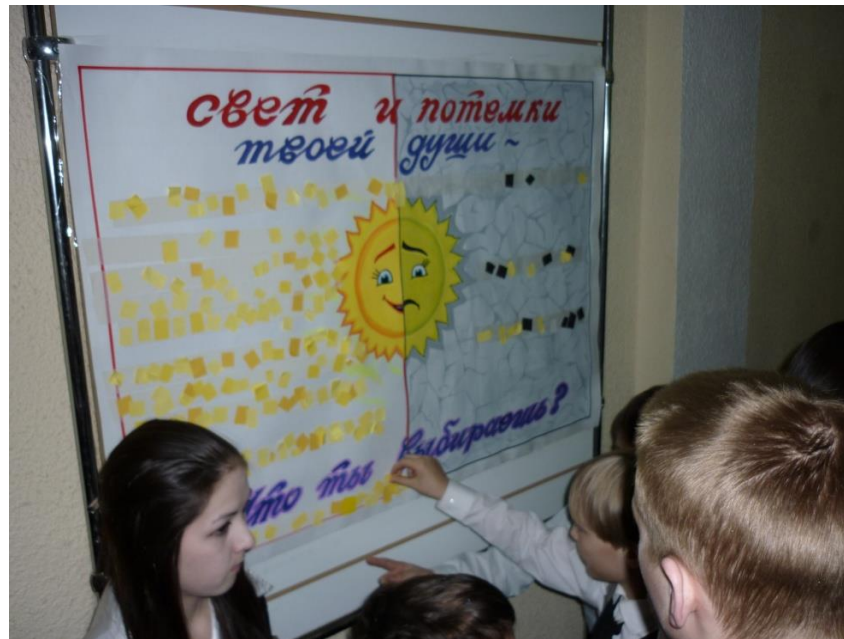
Акция «Кто я?»

Акция «Свет и потемки твоей души. Что ты выбираешь?»